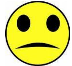
Hvordan gikk det? (endepunkt)