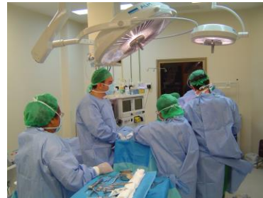
Hva gjør vi? Gjør vi det vi skal? (prosess)